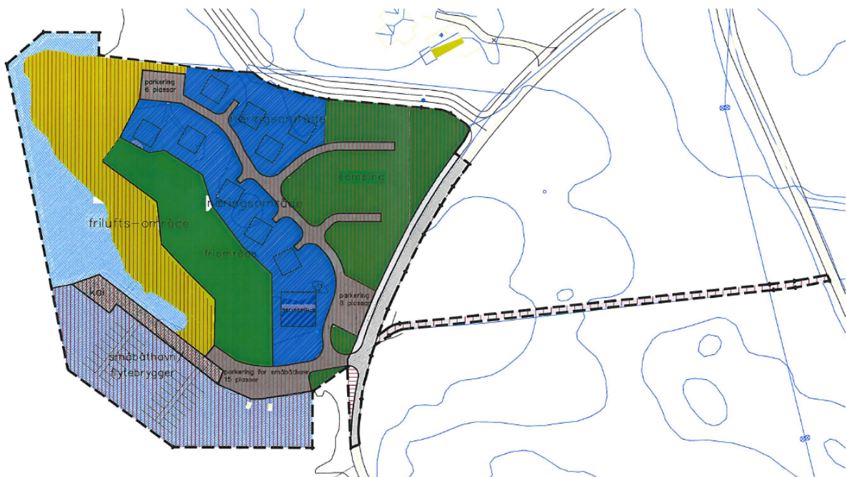
Plankart gjeldande plan, PlanID200504 Spona Camping

Føremålet med planendringa er å leggje til rette for noko utviding av område regulert til camping og næringsområde med sikte på å kunne utvide dagens servicebygning samt betre plasseringa av nye utleigehytter.